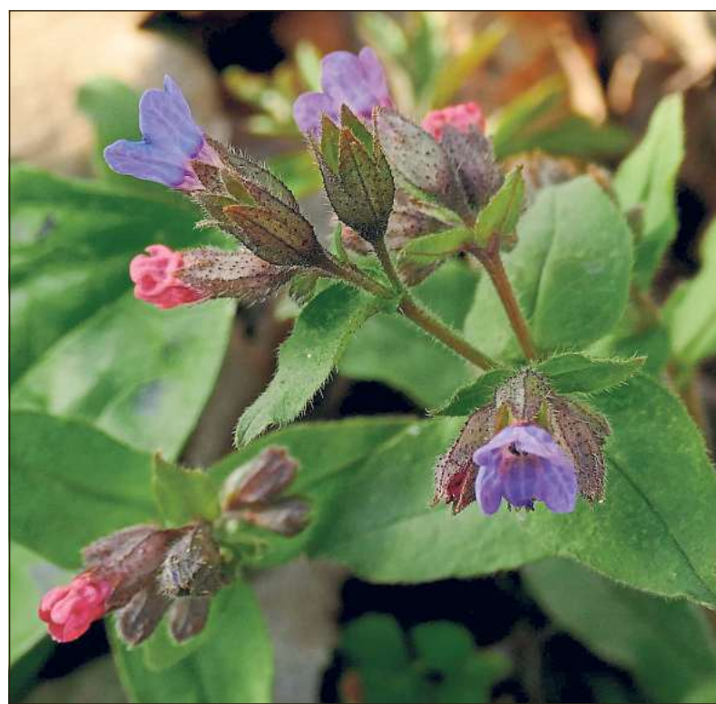
Körperlich, geistig und seelisch: Farben wirken auf allen Ebenen. Grün wird beispielsweise mit der Natur assoziiert und wirkt beruhigend.

Mössler-Wilmsen: Sie leiten sich von psychologischen Wirkungen, biologischen Gesetzmäßigkeiten und kulturellen Entwicklungen ab. Die rote Farbe des Bluts, das bei Verliebten schneller durch das Herz gepumpt wird, wurde zum Symbol für Liebe. Grün für Hoffnung kommt aus dem Neuwachen der Natur.